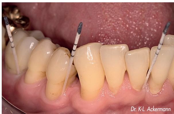
Abb. 2: Mikrobiologische Keimbestimmung mit Papierspitzen im Unterkiefer