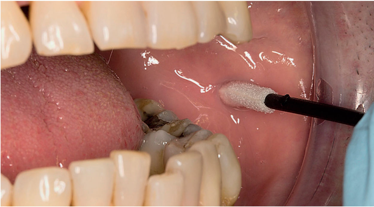
Abb.: Wangenabstrich zur Genanalyse